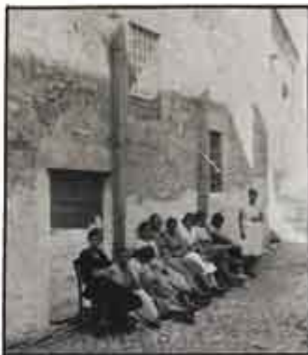
Κοπέλες αγκαθισμένες στον κάτω τοίχο της εκκλησίας της Παναγιάς.