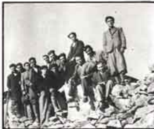
Περιμένοντας την εκκλιση το 1936, στον Άγλια.