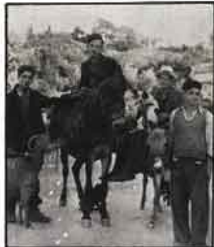
Οι χερομάχοι δουλευτάδες και τα ζώ τους, επιστρέφοντας στο χωριά...