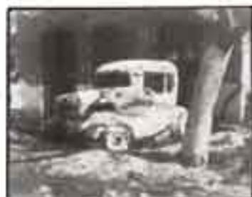
Ένα χιανότιο τροχοφόρο στο Σταθμό των Ασφακινήτων, στις 5 Φλεβάρη 1949.