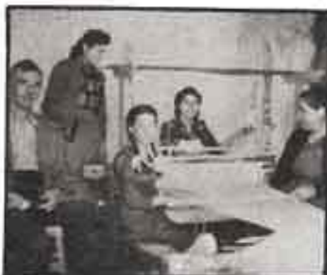
Οι τρεις ηλικίες στην υπηρεσία του αργαλειού...