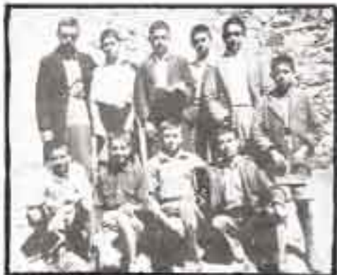
Μαθητές της πρώτης τάξης του Γυμνασίου Αγιάσου, το 1949.