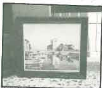
Το γραφικό εκκλησάκι της Παναγίας της Γαργάλας. Ελισσαγραφία Ειρήνης Τζαυή Χατζισάββα (Ιουστ. 56-55)