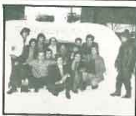
Χρόνια πολλά από το χειμαμένο Καιμπούδι (1978)